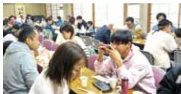
桜と餅つきイベント 会食