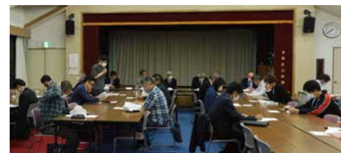
第2回茅野区各団体代表者懇談会